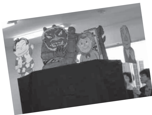
太郎認知症の巻 お花見バージョン