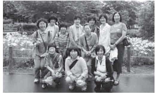
雨上がりの袖ヶ浦公園

道の駅には新鮮な野菜が並び、つつい財布の紐がゆるみがち。足湯体験・果物食べ放題。ユニークなバスガイドさんに導かれ、日常から解放された一日でした。