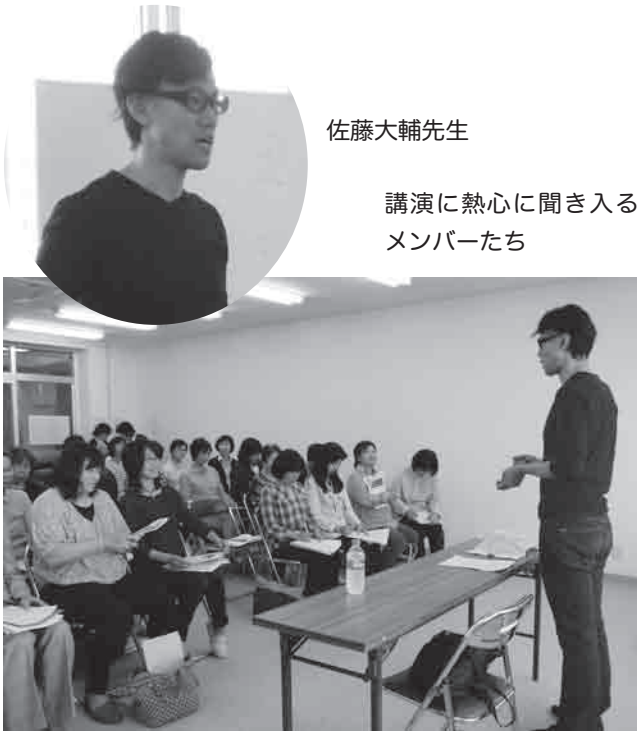
講演に熱心に聞き入るメンバーたち