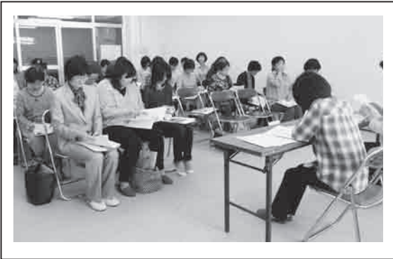
事業計画と予算を検討します

たすけあい心は21年目を迎えました。 2025年問題など社会はますますお互いの支え合いを必要としています。 創立の想いを忘れずに地域に根ざした活動を続けていきたいと思ひます