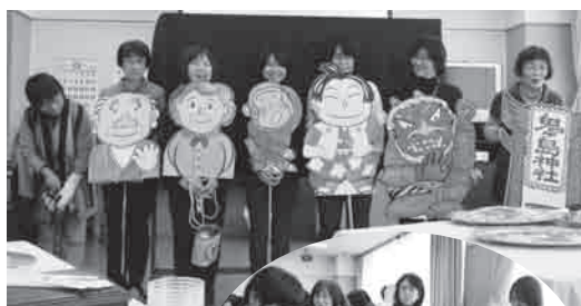
たすけあい心劇団