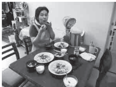
水曜・木曜は手作りランチ