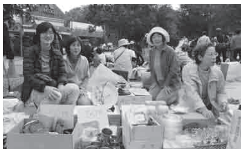
お天気も良くてなにより

野庭団地商店会のフリーマーケットに参加しました。メンバーからいただいた献品の売り上げ金27413円(寄付金もありました)を東日本大震災で保護者を亡くした遺児を応援する「毎日希望奨学金」に振り込みました。