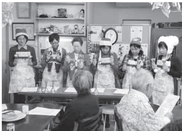
ミュージックベルで演奏 クリスマスメドレー